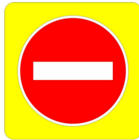
Panneau B1j. – Panneau de répétition d'interdiction d'accès à contresens de bretelles de sortie sur les autoroutes et routes à chaussées séparées sans accès riverain